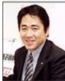
市議会議員 岩室 年治