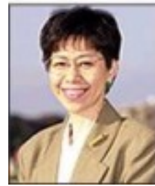
市議会議員 橋爪 明子